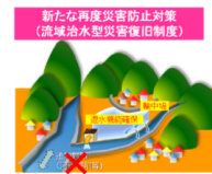
輪中堤又は遊水地の整備により、 浸水機能を確保しつつ家屋浸水を防御

令和4年8月の大雨により甚大な浸水被害が発生した九頭竜川水系鹿蒜川では、全国で初めて流域治水型災害復旧により採択されている。