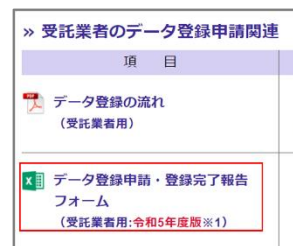
図 2 フォームのダウンロード

データ登録に関するご案内（道路管理者、受託業者のみ） http://rirs.or.jp/tenken-db/touroku.php のページにアクセスし、 「データ登録申請・完了報告フォーム」をダウンロードします。