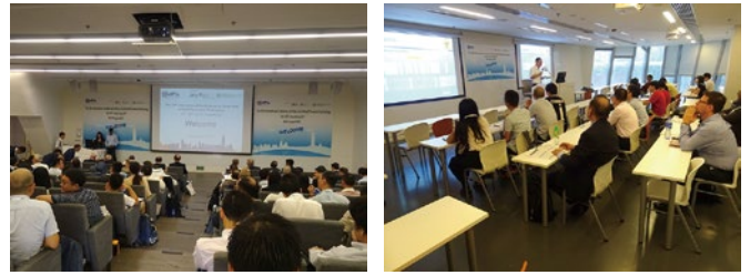
図-3 発表会場の様子

これまで述べたように、今回調査した中ではAI技術を活用した舗装の点検等の実施事例は見当たらなかった。