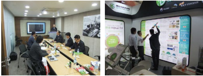
図-2 意見交換会（左）、技術の説明の様子（右）

韓国の道路舗装は、コンクリート舗装が標準であり、これまではコンクリート舗装とアスファルト舗装の比率は、約7:3であった。今後は、快適性の向上や都心での騒音を減少させるため、アスファルト舗装を5割程度まで普及させる予定とのことであった。その他に、橋面舗装やコンクリート舗装に関する説明が行われた。一方、日本側からはアスファルト舗装の長期保証制度や舗装技術の説明を行った（図-2）。両国にとって非常に有意義な意見交換の場となった。