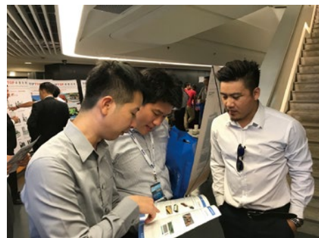
図-4 ヒアリング調査の様子

現在は人による道路の舗装状態の点検を行っており、AI技術を舗装の点検等に活用した事例はないものの、研究の実施や技術開発の推進が示唆された。