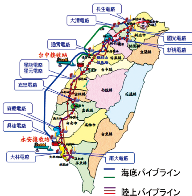
図-2 台湾の天然ガスパイプライン網