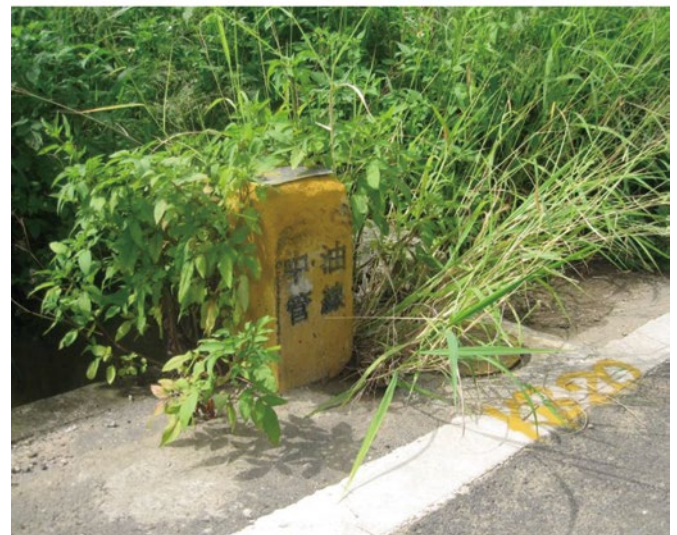
図-3 ガスパイプライン設置箇所