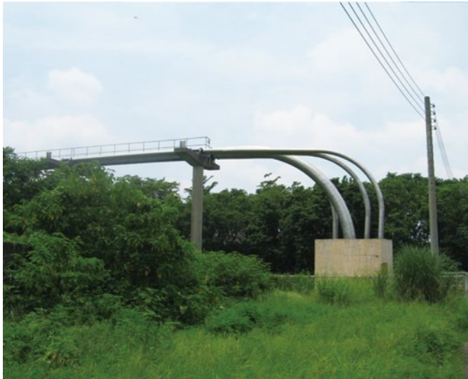
図-4は、台湾中部を流れる濁水溪を横断するパイプライン専用橋である。延長は約2.4kmで、4条のパイプラインが架設されている。

パイプラインが幅員の広い河川を横断する箇所には、高速道路に沿ってパイプライン専用の橋梁が架設されている。