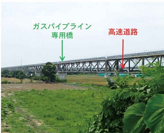
図-4 河川を横断するガスパイプライン専用橋