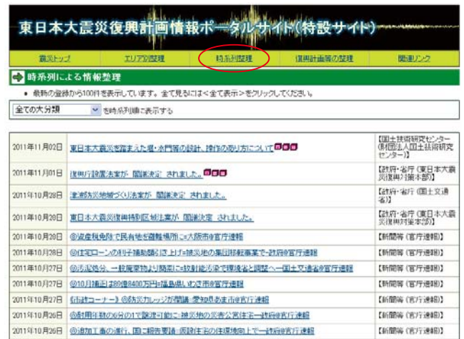
図 2-2 「時系列整理」画面

政府の復興方針や復興を支援する法律案、被災自治体の復興計画などについては、登録情報が 1 つ 1 つ収まっていますが、「復興計画等の整理」というリンクボタンで特出