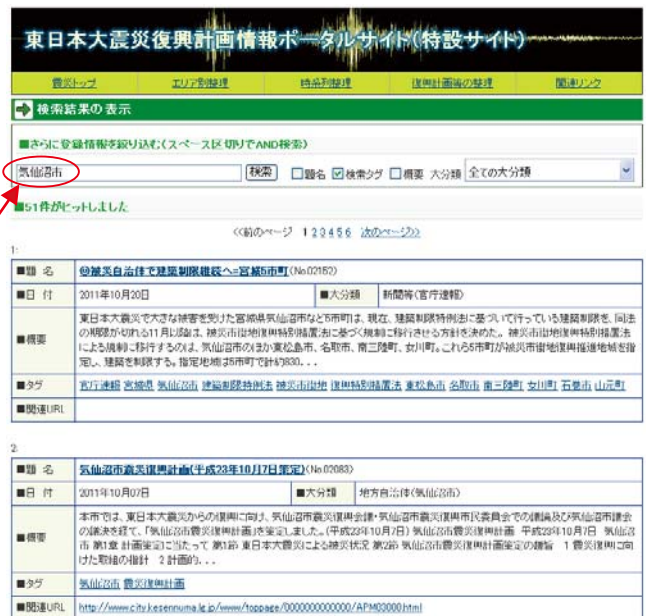
図 2-3 「検索タグ」で「気仙沼市」を選択し、気仙沼市に関する情報を時系列で表示した画面