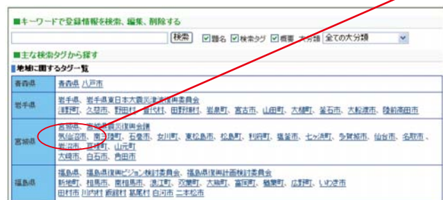
図 2-1 「検索タグ」を用いて登録情報を引き出す画面

検索窓に直接、知りたい情報のキーワードをフリー入力して登録情報を探し出すこともできます。