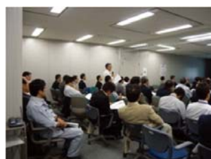
写真 成果報告会 会場の様子