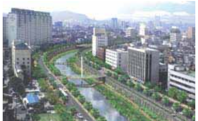
図 - 7 清溪川復元イメージ

の中心都市、国際商業都市、国際金融都市へ変革するという強力なビジョンを市民に提示した。そして、市民委員会を中心として、住民、専門家及び利害関係者の意見を受け入れ、フィージビリティ・スタディーおよび基本計画の策定の過程において、復元方法に関するいろいろな考察が行われ、現在、復元事業が実施されている。