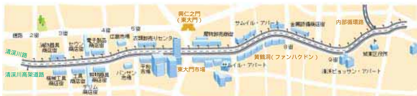
図-1 清溪川復元周辺