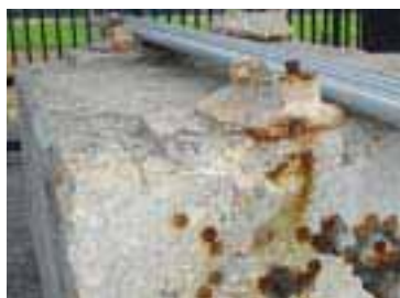
図-2 撤去した高架橋の沓座部分 (2004.8.6撮影)

バス路線、運営体系の全面的な改編により、バス利用客の増加を目指し、乗用車通行量を吸収(中央バス車路制度の導入 注 )、バス速度の向上、交通情報の提供、